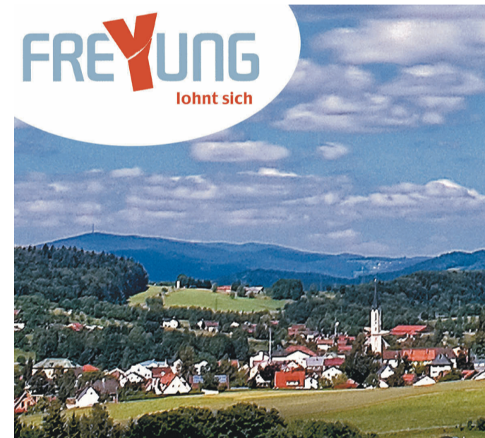
Luftkur- und Wintersportort 654 m - 860 m

Touristinformation / Kurverwaltung Freyung Rathausplatz 2 - 94078 Freyung Tel.: 0 85 51 / 588 - 150, Fax: 0 85 51 / 58 82 90 www.freyung.de touristinfo@freyung.de